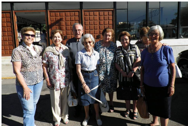
Los que asistimos de la Diócesis de Córdoba

Este año se han celebrado las XXXVII Jornadas de Formación en Castellón, en el Seminario Mater Dei, del 4 al 9 de agosto. Hemos asistido 23 diócesis con 81 adoradoras y siete Consiliarios.