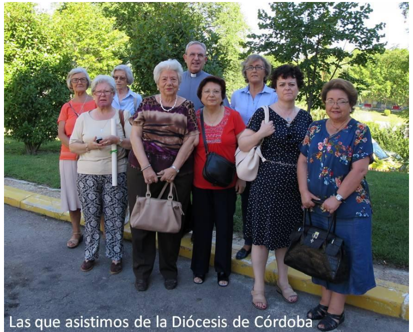
Las que asistimos de la Diócesis de Córdoba