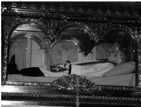
El Santo Cura tal y como se puede visitar en la iglesia de Ars

En la noche del 3 de Agosto llegó su obispo. El santo lo reconoció pero no pudo decir palabra alguna. Hacia la medianoche el fin era inminente. A las 2:00 a.m. del Sábado 4 de Agosto de 1859, cuando una tormenta azotaba el pueblo de Ars, el Obispo M. Monnin leía estas palabras: "Que los santos ángeles de Dios vengán a su encuentro y lo conduzcan a la Jerusalén celestial" , el Cura de Ars encomendó su alma a Dios.